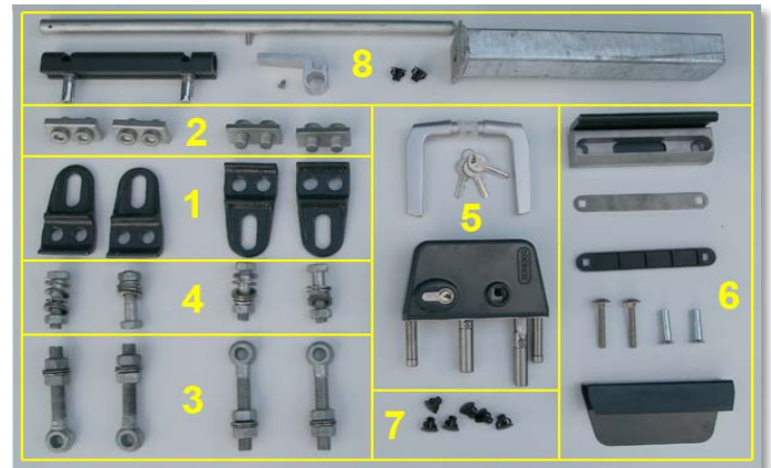
Zubehörset VARIO 2-flügelig

Führen Sie die folgenden Schritte zur Montage des Zubehörs durch: