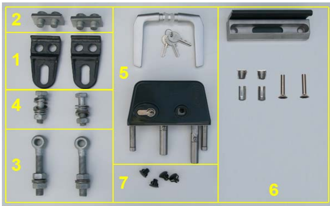
Zubehörset VARIO 1-flügelig

Zum Lieferumfang eines VARIO-Tores gehört ein umfangreiches Zubehörpaket mit hochwertigen Komponenten.